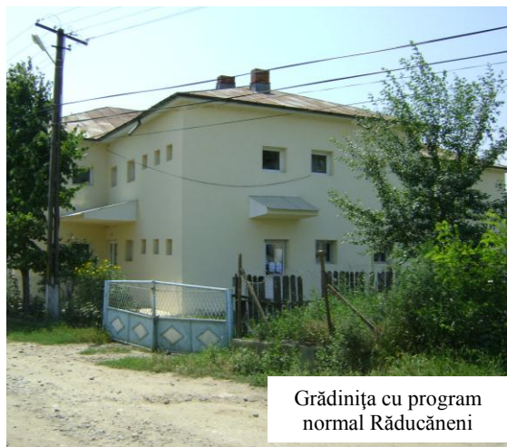
Grădinița cu program normal Răducăneni