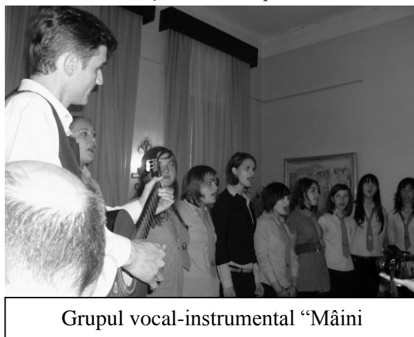
Grupul vocal-instrumental "Mâini"

Iubire într-un vers...albastru! - « Iubirea împărtășită de oameni este forța cea mai mare care există în lume și izvorul cel mai important pentru poezie », spunea Octavian Paler într-una dintre cugetările despre poezie și iubire. Poezia izvorăște dintr-o forță iar forța aceasta este de fapt o stare a sufletului. Sufletul este călimara cu cerneală în care trăirile se împletesc într-un amalgam (paradoxal !) perfect, dar ele nu capătă existență materială decât rânduite pe hârtie, sub condeiul iubirii. Este modul cel mai firesc, mai simplu și mai onest în care Elena Olariu ne dezvăluie, cu un zâmbet timid, stări și emoții nu de puține ori ținute doar pentru sine. (prof. George POPA, Liceul Răducăneni)