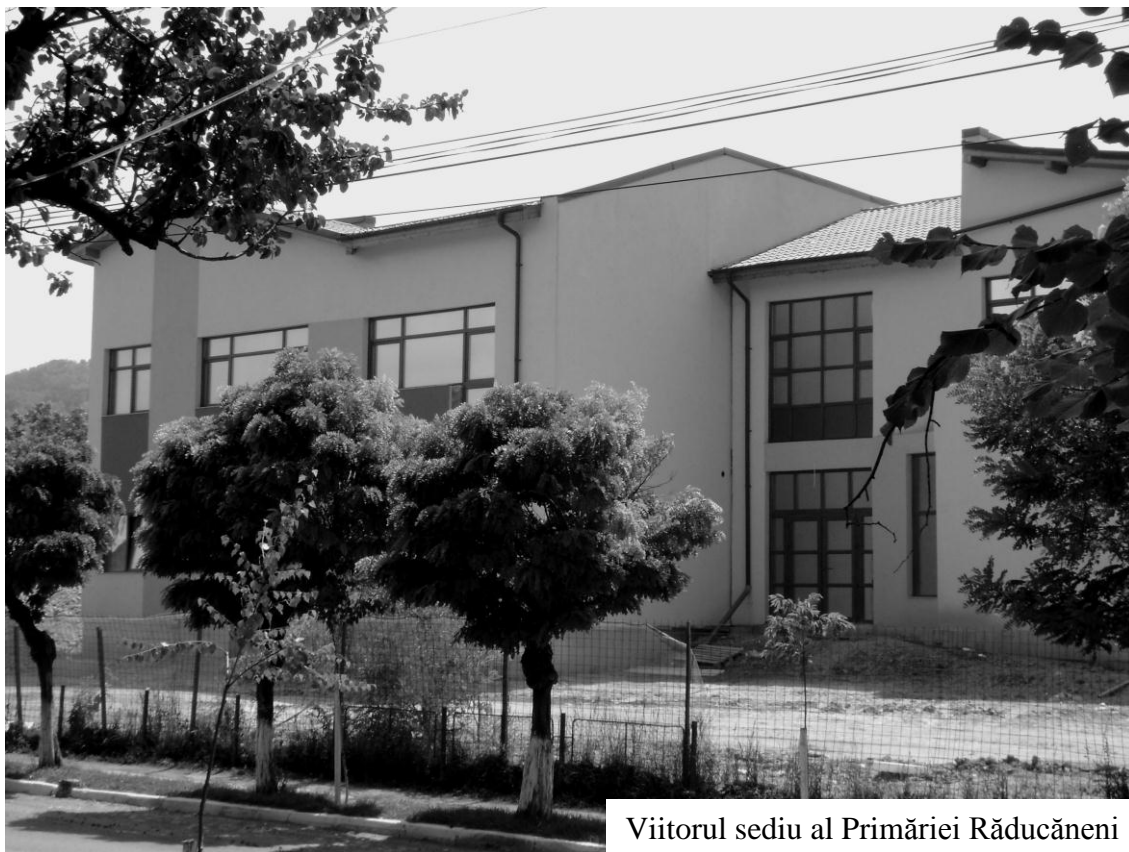
Viitorul sediu al Primăriei Răducăneni

Publicația comunei Răducăneni, Anul III, numărul 21, iulie-august 2011