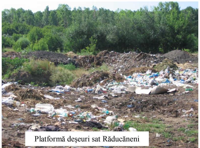
Platformă deșeuri sat Răducăneni

3. În cazul în care contravenientul nu se conformează măsurilor dispuse în procesul verbal de sancționare a