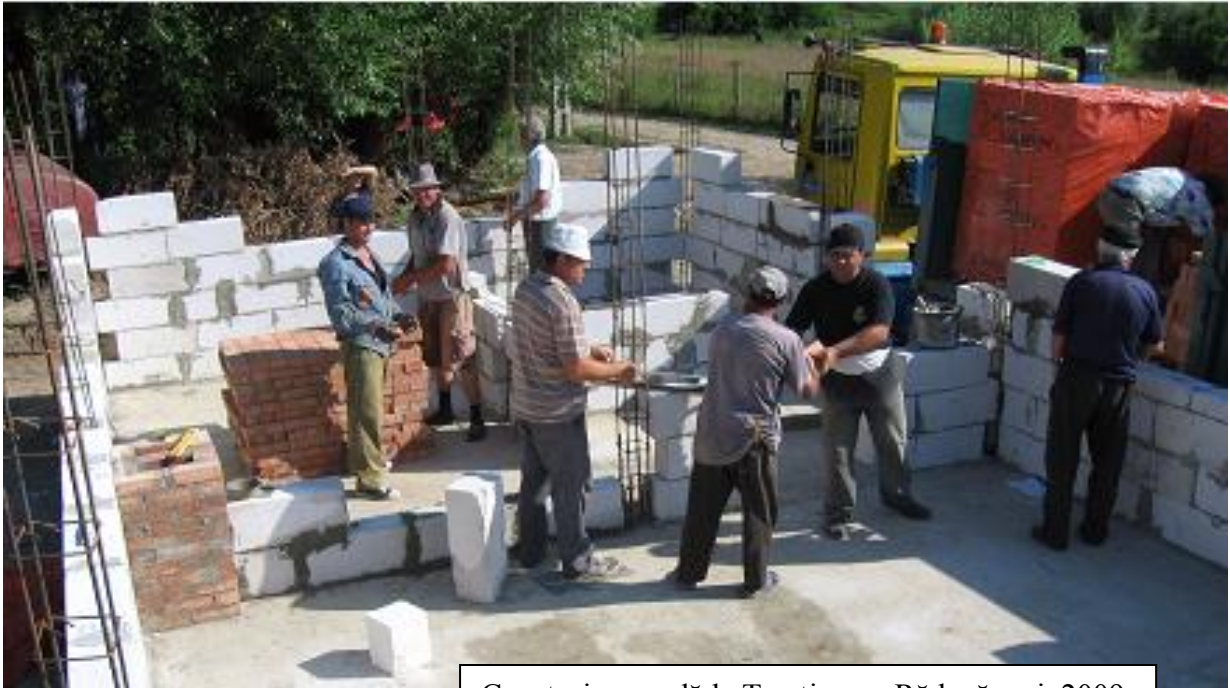
Construire școală la Trestiana – Răducăneni, 2009

Publicația comunei Răducăneni, Anul II, numărul 9, iulie-august 2009