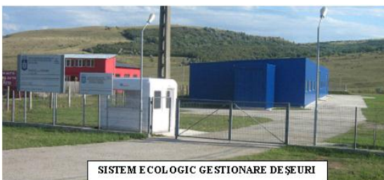
SISTEM ECOLOGIC GESTIONARE DEȘURI