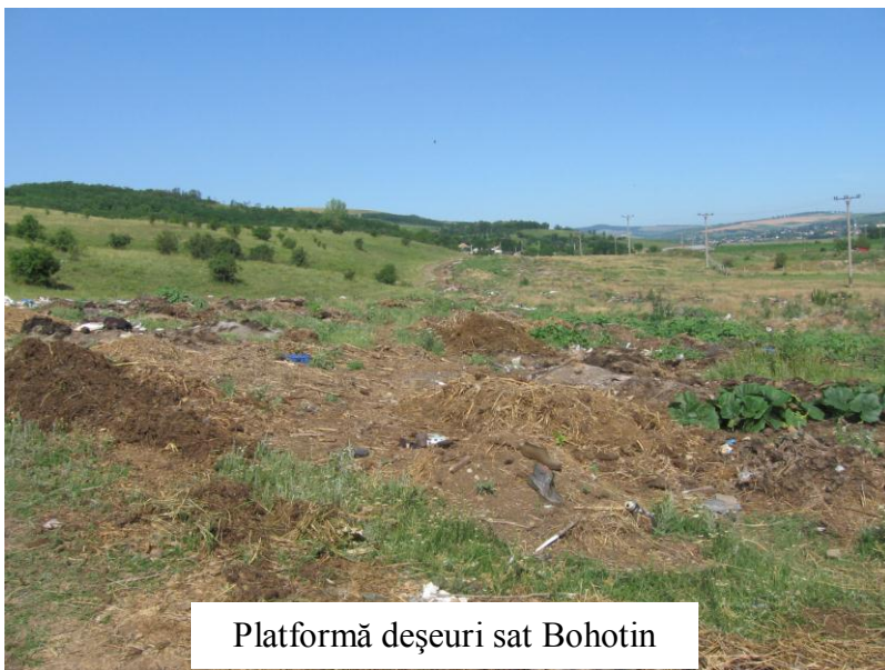
Platformă deșeuri sat Bohotin

2. Neînștiințarea serviciilor de specialitate din cadrul Primăriei Comunei Răducăneni despre lucrările de construcții de orice fel de unde rezultă pământ, moloz sau alte asemenea reziduuri în vederea stabilirii traseelor pentru transportul și depozitarea acestora;