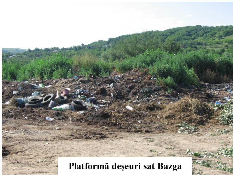
Platformă deșeurii sat Bazga

Depozitarea materialelor de construcții și montajul schelelor pe trotuare (protejate), carosabil, zone verzi în vederea executării lucrărilor de construcții sau reparații se va putea realiza numai după aprobarea solicitării scrise, a plății taxelor legale și emiterea autorizației de către birourile de specialitate ale Primăriei Comunei Răducăneni.