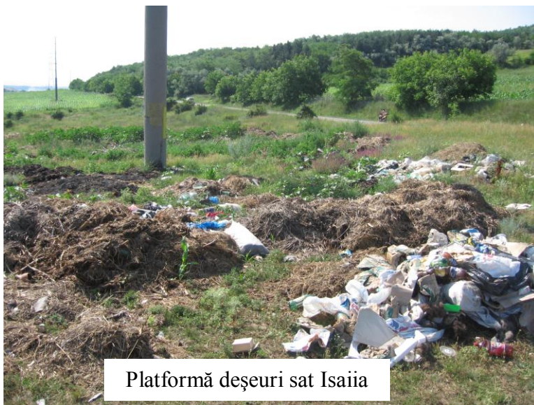
Platformă deșeurii sat Isaiia

2. Să întrețină curățenia pe trotuarele și spațiile verzi aferente imobilelor și locurile de parcare pe care le deține sau le folosesc, să curețe zăpada și gheața imediat după depunere sau până la ora 10.00 dimineața de pe trotuarele și rigolele din fața imobilelor pe care le dețin sau administrează. Zăpada sau gheața rezultată se depozitează la o distanță de 0.30m de bordura carosabilului. În cazul formării poleiului, trotuarele vor fi presărate cu nisip sau rumeguș.